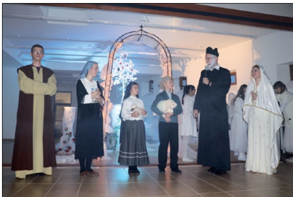
Sv. Jozef, fatimské deti, sv. Filip Neri a Panna Mária.