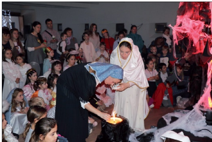
Pri strome „peklo“ pochopili význam modlitby za záchranu duší.