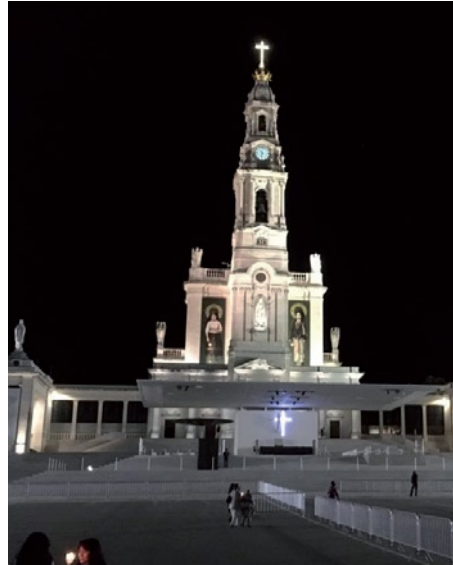
Bazilika Panny Márie Ružencovej vo Fatime

Program púte bol bohatý. Počas krížovej cesty, ktorá mapuje zvyčajnú trasu pastierikov, sme rozjímali o ich poslaní: Čo bolo svetu slabé, vyvolil si Boh . Navštívili sme ich rodné domy v Aljustrele a znovu prežívali životné osudy vyvolených detí. V Sanktuáriu sme si prezreli Baziliku, v ktorej sú uložené ostatky malých pastierikov, v múzeu votívnych