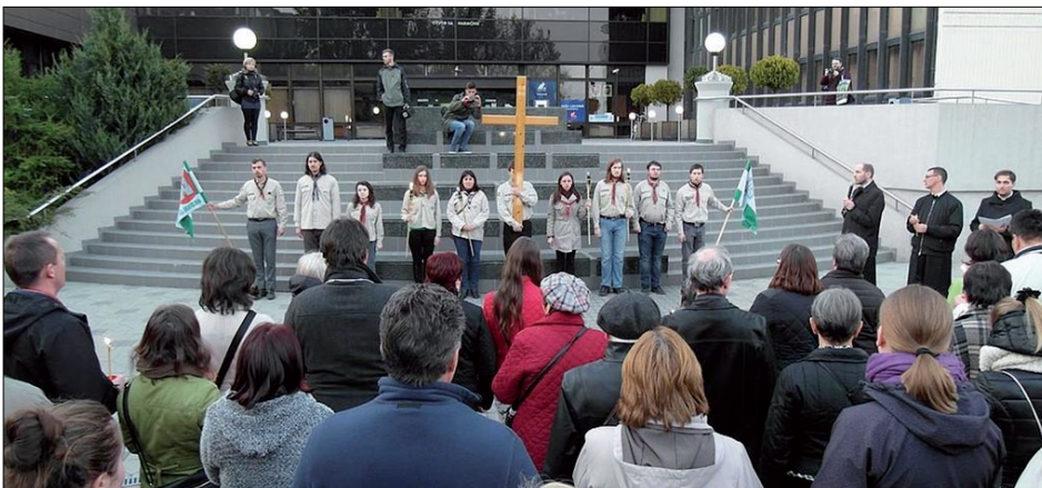
"Naša" krížová cesta má každý rok počas pôstu silné poslanstvo.