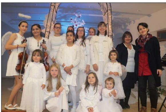
Anjelský chór radostne spieval aj do tanca.