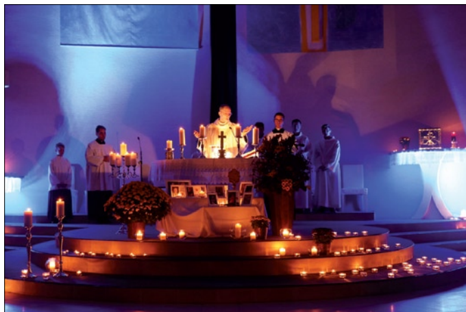
Skutočným „nebom na zemi“ je svätá omša.