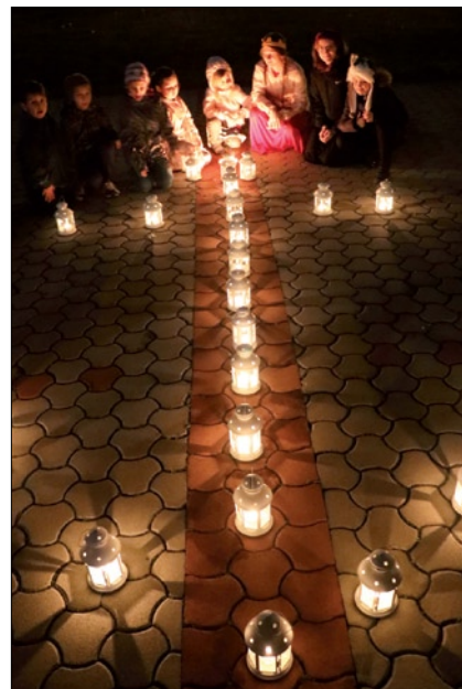
Križ z lampášov pred kostolom ukončil pochod svetla.