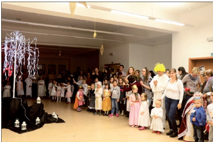
Deti ako „svätci“ zážitkovo poznávali pravdy viery.

Nebo, očistec, peklo. Katechéza pri žiarivej scéne nebeskej brány a stromu života. Taký bol Večer svätých pred sviatkom Všetkých svätých 31. októbra 2017 v našej farnosti Svätej rodiny. Do pastoračného centra prišlo vyše sto detí. Malým „svätcom“, ktorí prišli v sprievode svojich rodičov, sa venovali kňazi a animátori. Ako to dopadlo? Len sa pozrite! (Viac na www.svatarodina.fara.sk ).