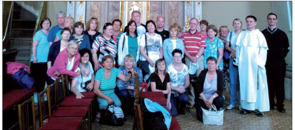
Členovia ružencového bratstva navštívili Rád dominikánov v Košiciach.