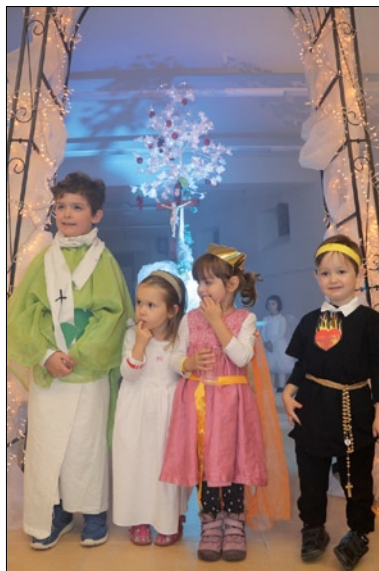
Šťastné deti pod nebeskou bránou.