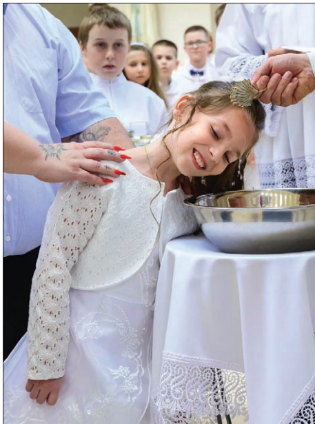
Krst ako prvú sviatosť kresťanskej viery prijalo 5 detí. Každé z nich sa stalo Božím dieťaťom a členom Katolíckej cirkvi.

Slávnosť prvého svätého prijímania sa v našom Kostole Svätej rodiny uskutočnila 21. mája 2023. Pre každé dieťa a jeho rodinu ide o jedinečnú udalosť a medzník v duchovnom raste.