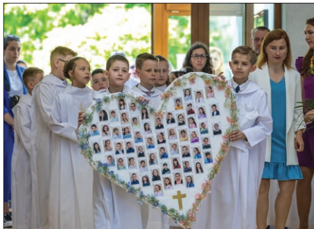
Zástup detí si v tvare srdca niesol 57 fotografií. Presne toľko bolo tých, čo túžili prijať Pána Ježiša v Eucharistii.