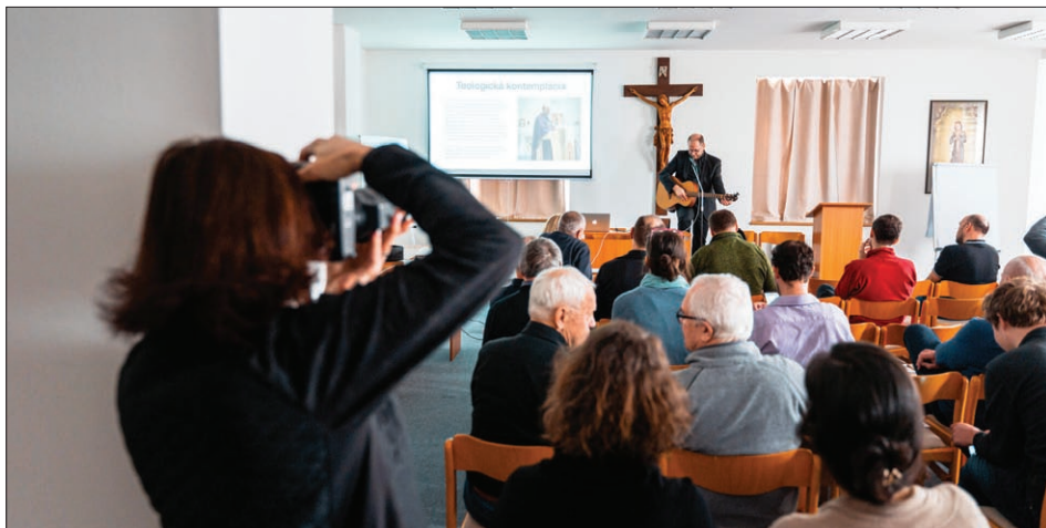
Fotografovanie fascinuje, lebo dokumentuje dôležité okamihy života vrátane života Cirkvi.