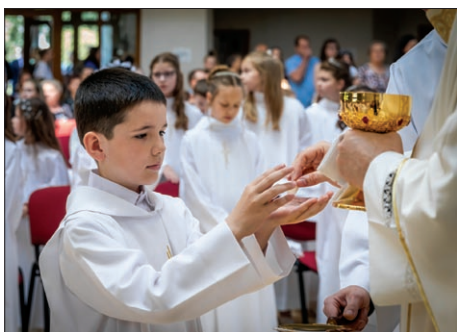
„Telo Kristovo“. „Amen“. Prijatím eucharistického Krista nastala vzácna a krásna chvíľa v živote malých kresťanov.