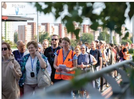
Návšteva kostolov: z Petržalky po moste