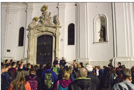
Putovali sme do Kostola sv. Jána z Mathy