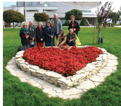
Od začiatku roka seniori uskutočnili už 17 brigád, aby zveľadili okolie nášho kostola. Ďakujeme vám!

Pribudli nám dve aktivity vzdelávacieho charakteru – zlepšovanie digitálnych zručností v spolupráci s Digitálnou koalíciou, ako aj zvyšovanie finančnej gramotnosti v spolupráci s Národnou bankou Slovenska. Aj ich prostredníctvom chceme prispieť k tomu, aby seniori boli lepšie pripravení na výzvy meniacej sa spoločnosti.