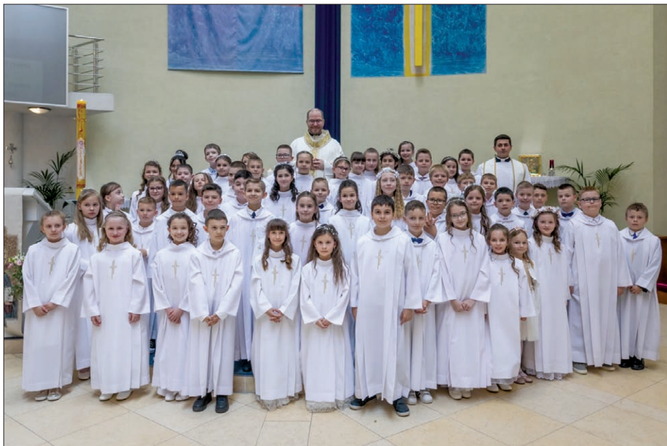
Radosné fotografovanie na záver s našimi duchovnými otcami, ktorým ďakujeme za prípravu i vyslúženie sviatostí.