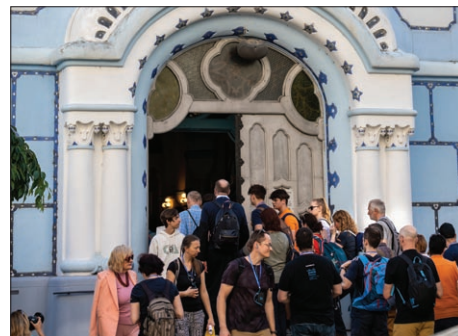
Prvým posvätným miestom bol Modrý kostol