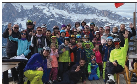
Po športovom i duchovnom tréningu v Cortina d'Ampezzo sme sa tešili z nových síl.