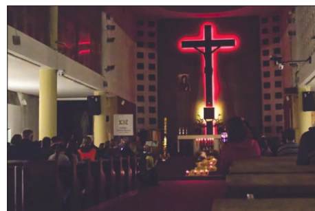
Záver v Kostole Povýšenia Svätého kríža