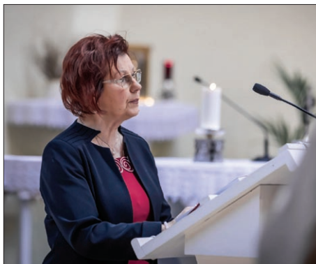
Lektor sa oboznámi s textom zo Svätého písma a hľadá najvhodnejšiu formu prednesu.

Služba lektora si vyžaduje prípravu na čítanie aj vtedy, ak samotný lektor je profesionál a nemá problém s dodržiavaním spisovnej výslovnosti či ovládaním prozodických vlastností slovenčiny. Správne a zrozumiteľné čítanie nezahŕňa len formu prejavu, teda výslovnosť, ako sa často domnievame, ale celkový účinok závisí vo veľkej miere od pochopenia prednášaného textu. Aby sme lepšie porozumeli, čo k nám Boh vo vybranom čí-