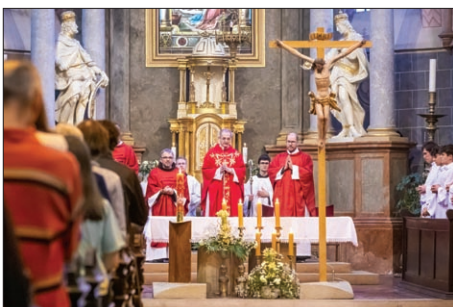
U františkánov svätá omša s o. arcibiskupom